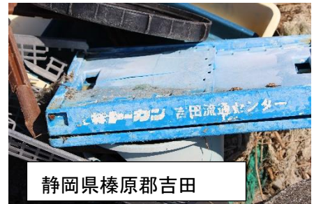
静岡県榛原郡吉田