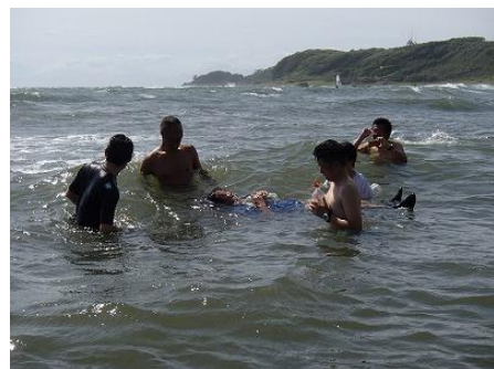
まずはペットボトルで「ラッコ浮き」