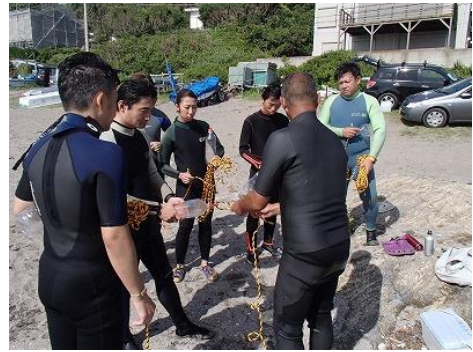
使い方のレクチャーを受けます。