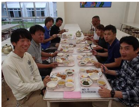
夕食タイム！いただきますっ！