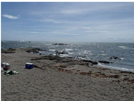
実施場所はこちら（和田浜海岸）