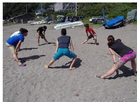
まずは準備体操（大切です！）