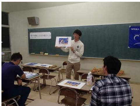
先ほどの紙芝居を使って、実演してみましょー！