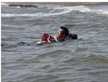
今回もランドセル・・・浮いてます！