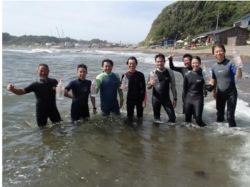
海での実技演習が無事終了！みなさん頑張りました。