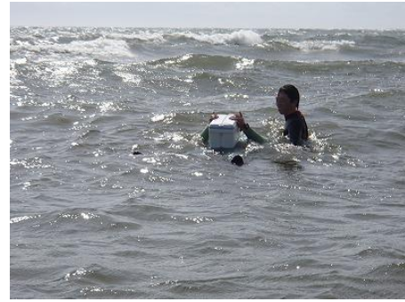
身近な物を使った浮力体験（保冷BOX）