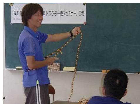
落水した人への救助方法