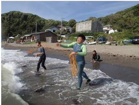
実際に救助してみます。ペットボトルが頭に当たらないように気を付けて！