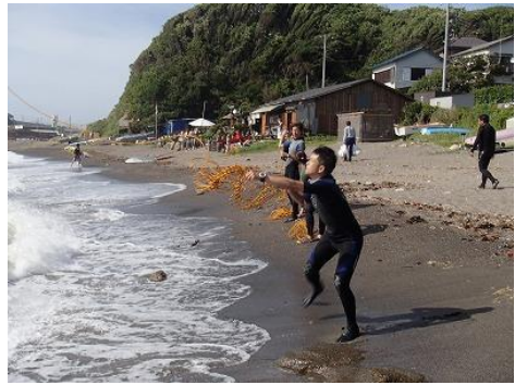
でも、皆さんすぐにコツをつかみました