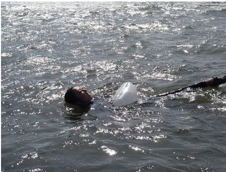
ビニール袋（結構浮くんですね！）