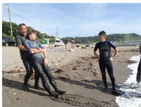
一人で運ぶ方法（知っておきたいですね）