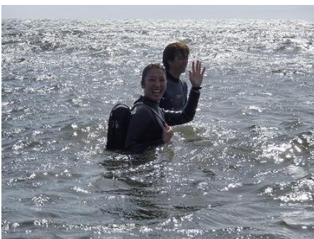
ランドセル・・・人気です！