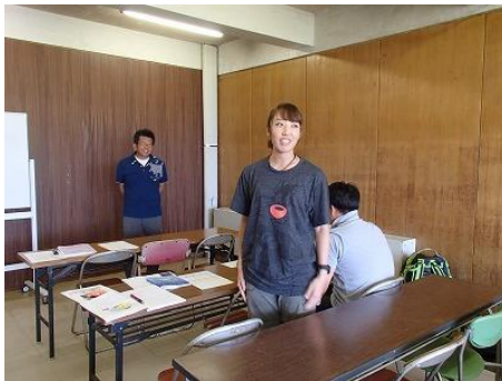
自己紹介（緊張気味？）