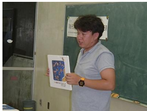
さすが、みなさんプロ！とても上手です！