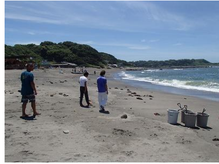
海の状況を確認（台風11号接近中！）