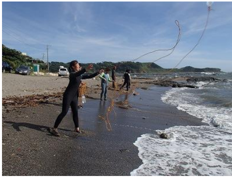
それでは、投げてみましょー！意外と難しい??