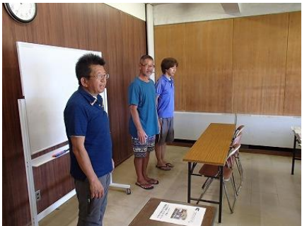
講師陣の紹介（よろしくお願ひします！）