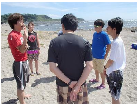
小池理事から事前説明