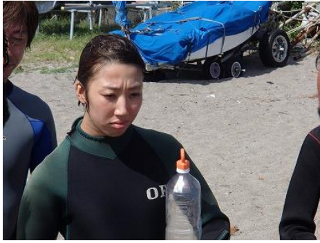
「これがレスキューキャップかー」