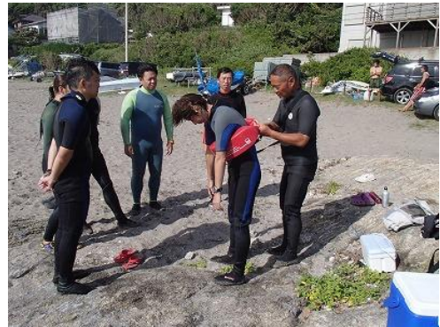
続いて、レスキューチューブの使用法