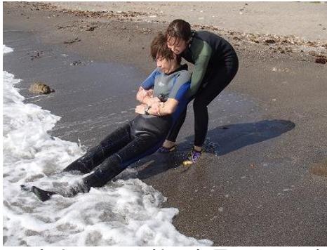
この方法・・・女性でも運べるんです！