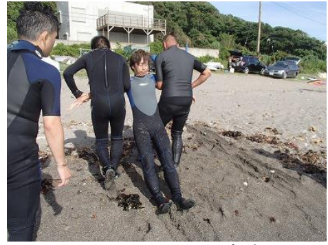
二人では、この方法！