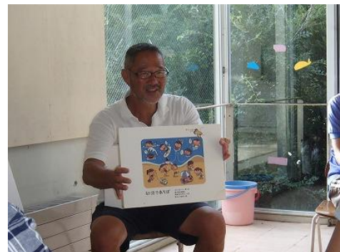
話し方などコツがあるんですね