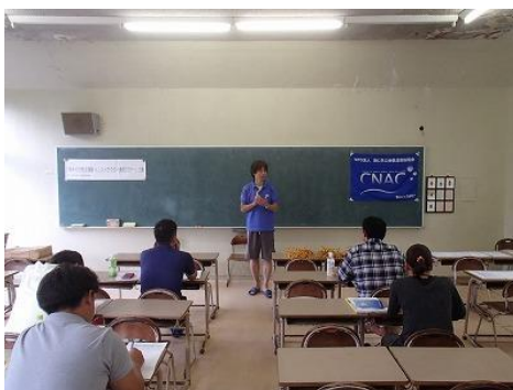
続いて、小池理事による 実習部分を室内で実施する場合の実習