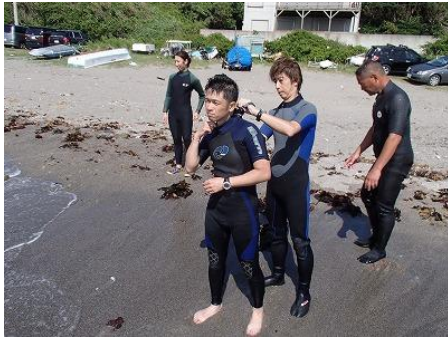
ウェットスーツに着替えて・・・