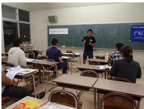
海遊び安全講座開催方法についての意見交換