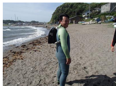
参加者も似合ってますよ！