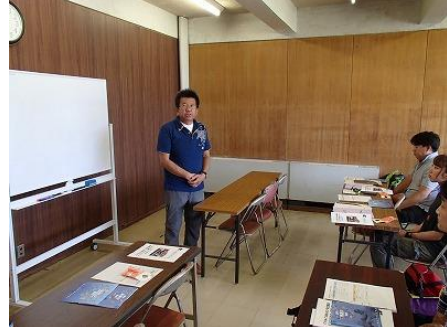
海あそび安全講座について三好代表から説明