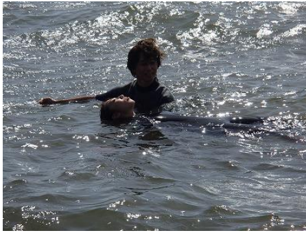
まずはウェットスーツの浮力体験