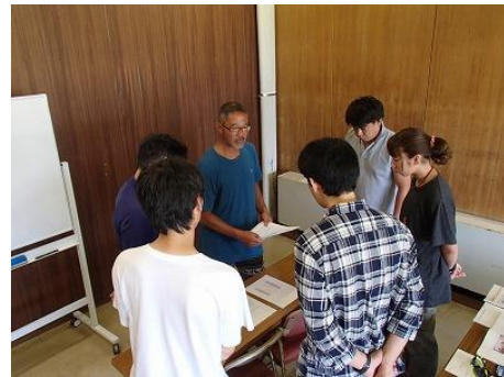
海へ行く前の注意事項