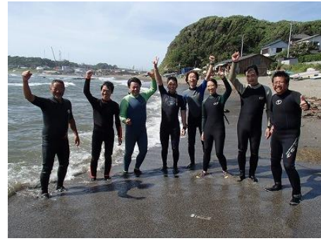
記念撮影！気合十分！（カッコいいです！）