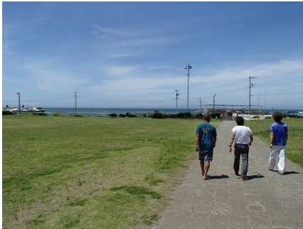
海の状況を確認に向かいます！（絵になります！）