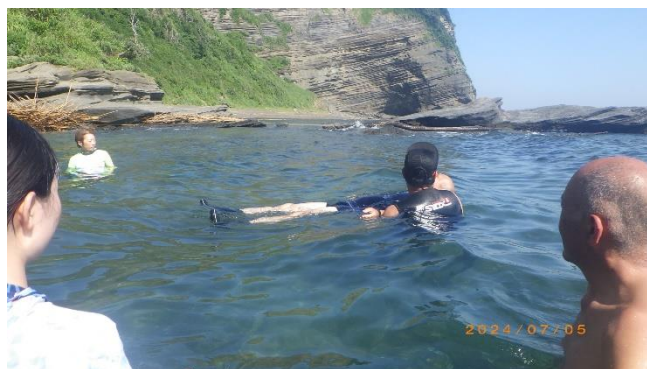
支えて浮かぶ（講師）