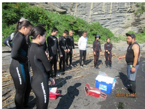
ウエットスーツを着用