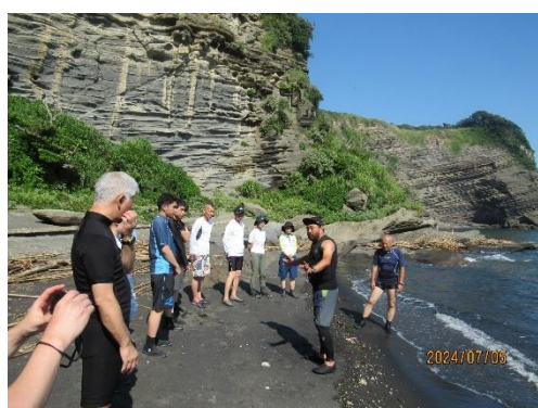
海中実習ブリーフィング