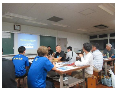
海から戻り講義再開