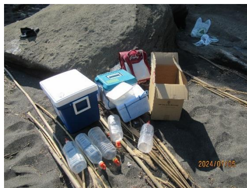
今回用いた浮力体