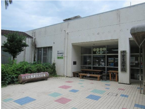
大房岬自然の家 外観