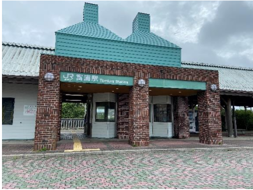
JR 富浦駅 外観