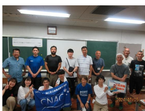
1日目お疲れ様でした！