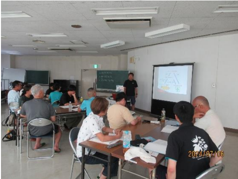
リスクマネジメントについて