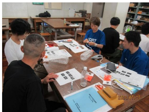
みんなで教え合う