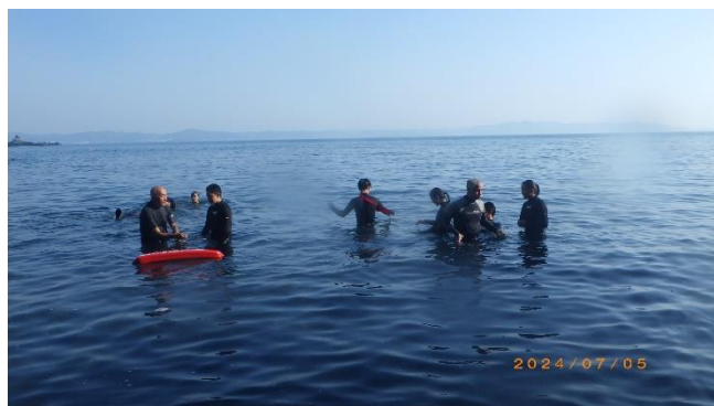
レスキューチューブ