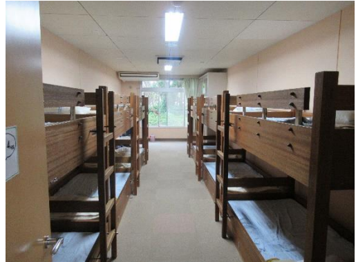
部屋 ※12人部屋を3名で使用