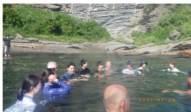
海の水温に慣れる