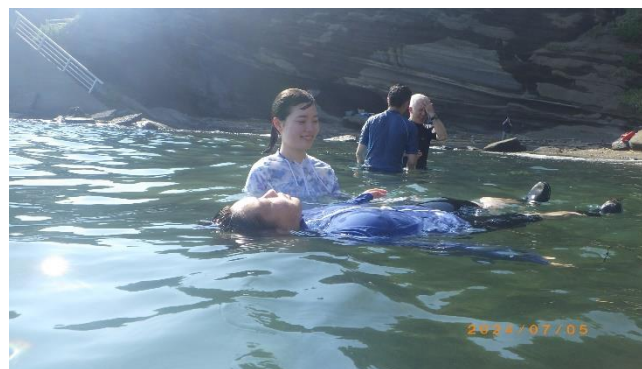
支えて浮かぶ（実践）