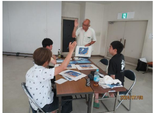
キケンくん探し実習（グループC）