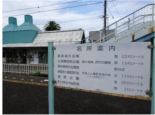
JR 富浦駅 ホーム名所案内 自然の家記載あり