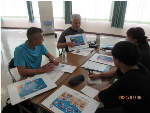
キケンくん探し実習（グループB）