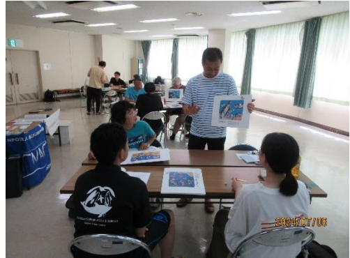
キケンくん探し実習（グループA）