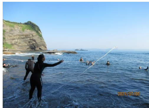
ペットボトルレスキュー（実践）