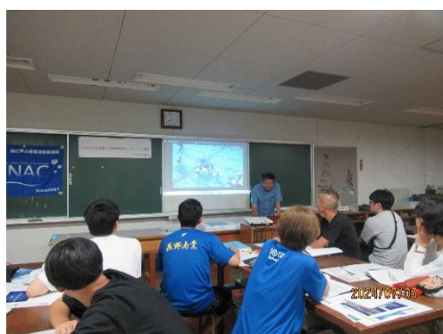
海遊び安全講座の開催方法について