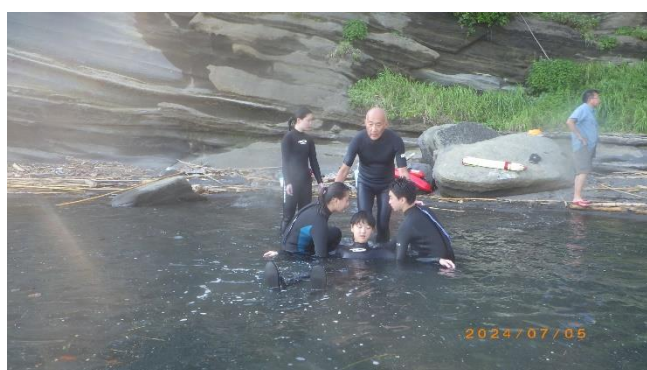
2人1組での救助（実践）