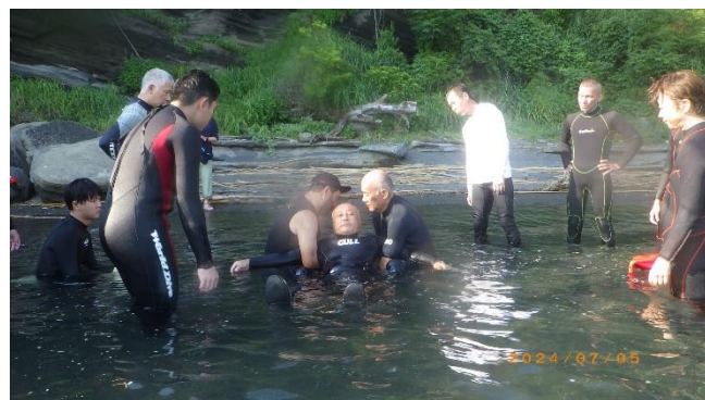
2人1組での救助（講師）