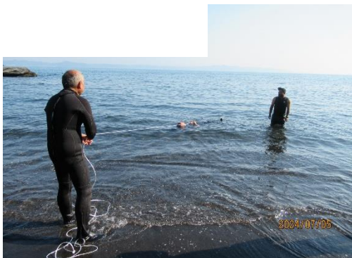
ペットボトルレスキュー（講師）