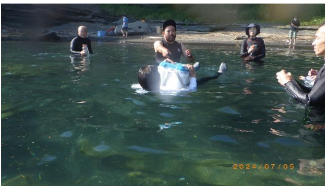
クーラーボックス