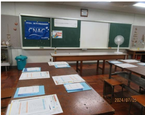
会場設営 ※6人掛け机を4名で使用