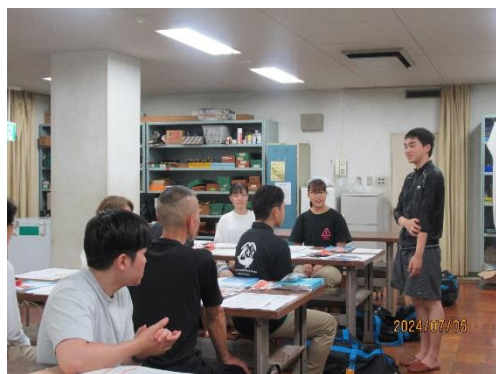
参加者による自己紹介