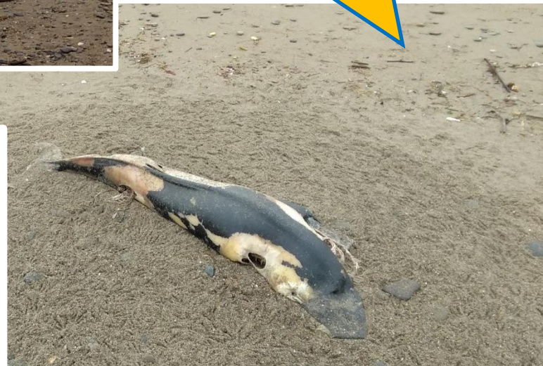
活動場所で見つけたスナメリの死体